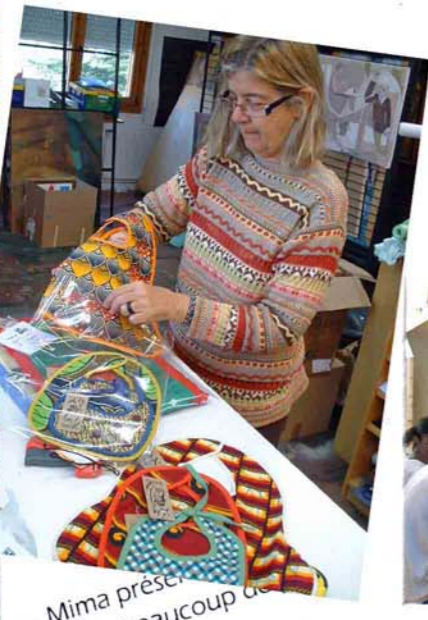
Mima présente avec beaucoup de...