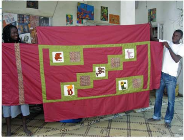
couvre-lit patch et appliqués (sur commande)