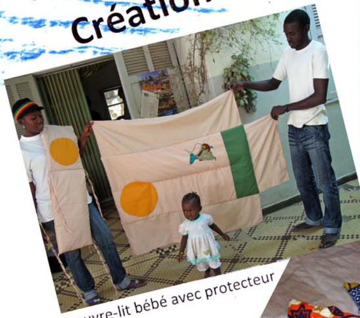
couvre-lit bébé avec protecteur