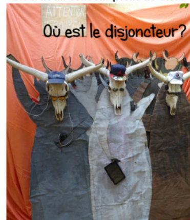
Du 3 au 12 mai, de 10 à 13h et de 15 à 19h adresse: « Kër Taizé » - Ak benn dans le quartier LICHAU-GRAND YOFF, tout près de l'hôtel de ville de Grand Yoff (CTD) Site web : www.akbenn.webs.com blog www.akbenn.bloggspot.com tel. 338 272 308