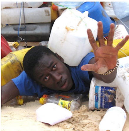
wëy sama ndey ! Notre maison commune ! Un regard sur « Laudato Si » Du 8 au 17 avril. De 10 à 13h et de 15 à 19h